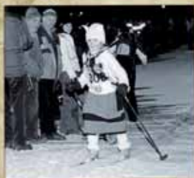
fondo dei bocia