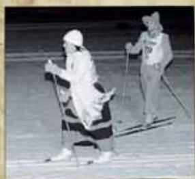
fondo dei granc'

Punteggi Premio legati all'abbigliamento dei concorrenti (obbligo colori di Reparto, ammessi vestiti "a la végia", costume bormino come da regolamento).