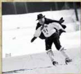
discesa dei granc'